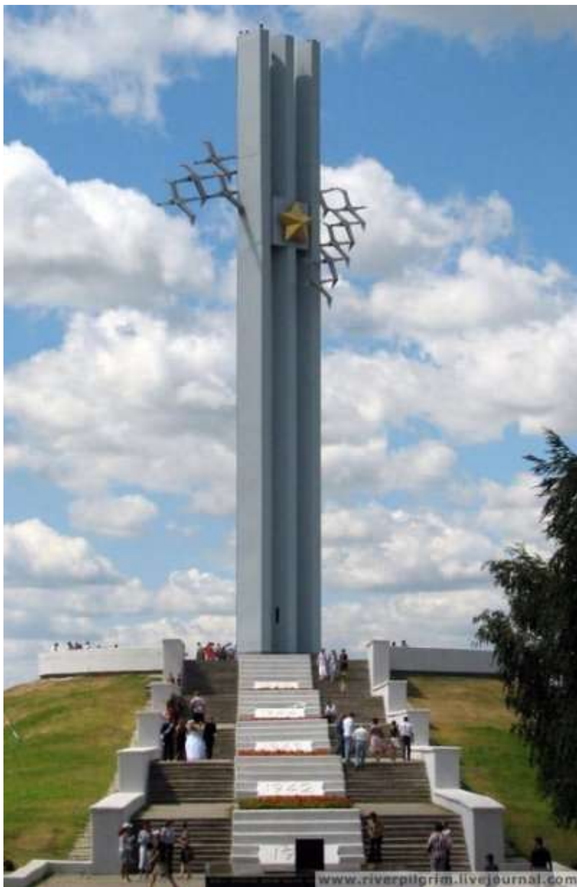
Слайд 11. г. Саратов.