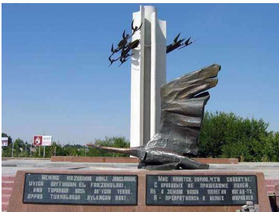
Слайд 12. Узбекистан. г. Чирчик.