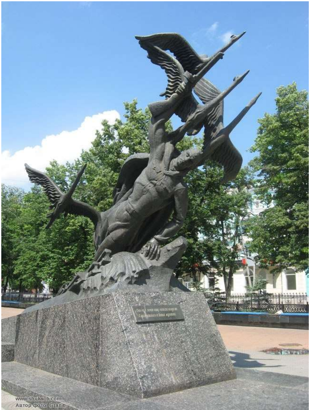
Слайд 13 Украина. г. Луганск.