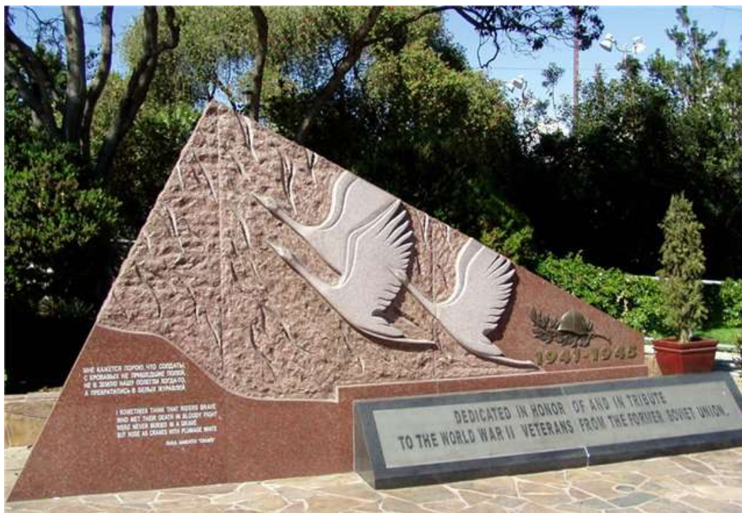
Слайд 10. Мемориал в Голливуде.