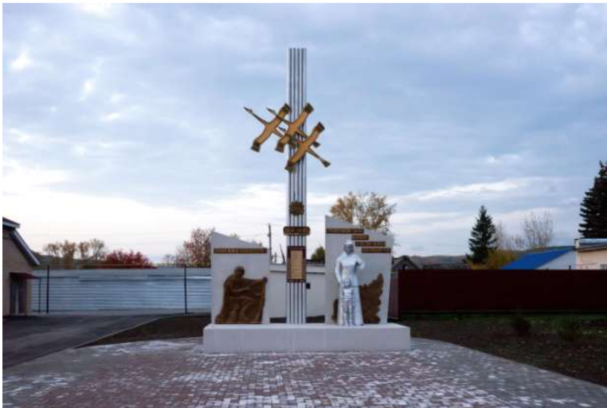
Слайд 14. Мемориал в селе Шугурово Лениногорский район Республика Татарстан