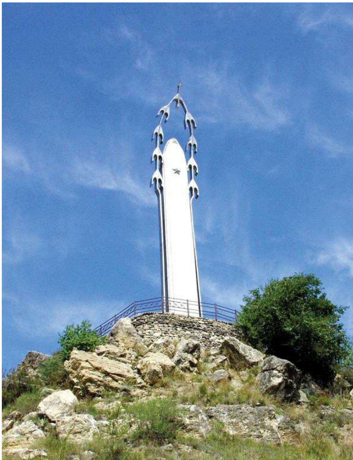
Слайд 9. аул Гуниб Республика Дагестан