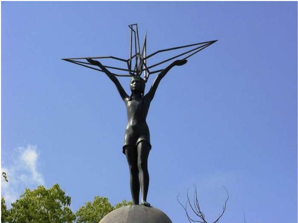
Слайд 4. Памятник Садако Сасаки