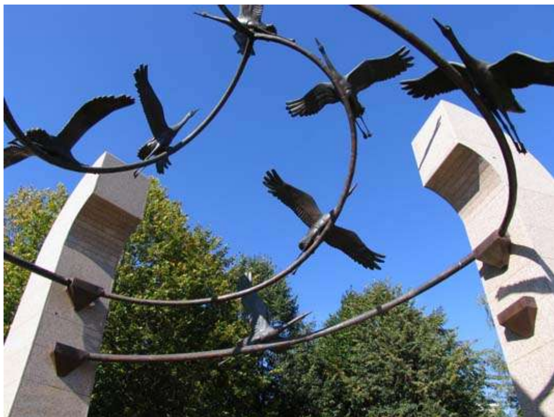
Слайд 7. Памятник погибшим. г. Видное в Подмосковье.