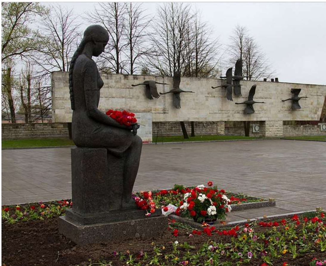
Слайд 6. С-Петербург. Невское воинское кладбище.