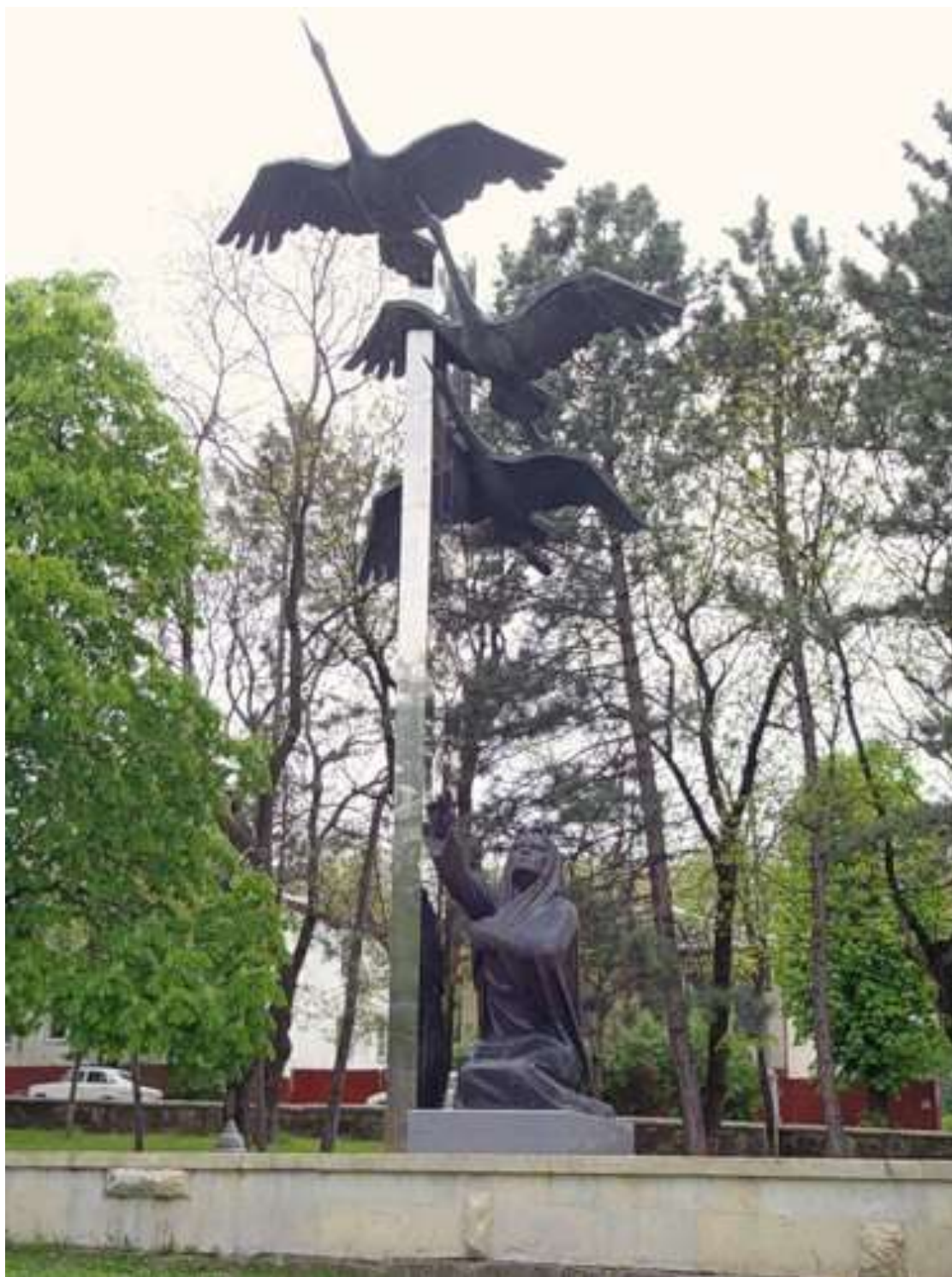
Слайд 8. Мемориал в Кисловодске.